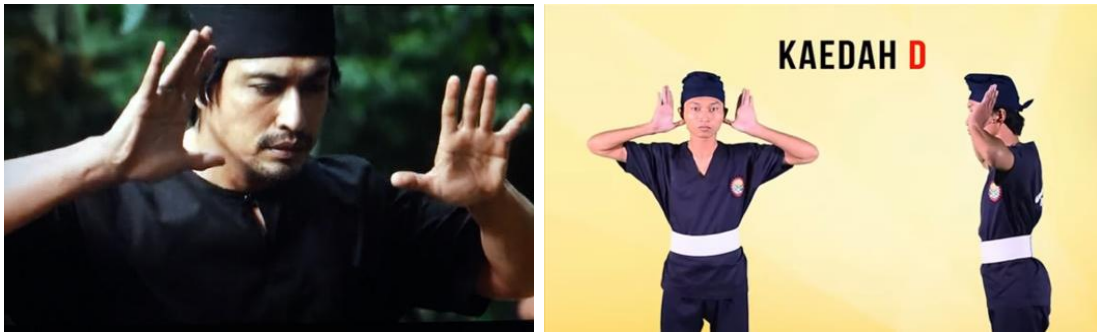
Gambar 10: Pergerakan Silat Cekak Pusaka Hanafi.