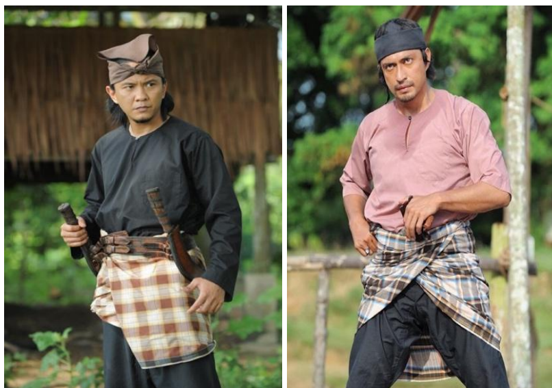
Gambar 5: Pakaian Lelaki Rakyat Biasa

Busana dalam filem MKKP (2022) turut melalui transformasi. Terdapat dua kategori pakaian, iaitu pakaian dan hiasan kepala bagi rakyat biasa dan golongan bangsawan. Pakaian rakyat biasa bagi kaum lelaki adalah baju, seluar panjang, kain diikat di pinggang sehingga paras lutut dan memakai destar di kepala. Hal ini dapat dilihat menerusi beberapa watak seperti Mat Kilau, Awang, Wahid, Yassin, Brahim, Usup, Mat Lela, dan watak orang kampung merujuk kepada gambar 5 di bawah: