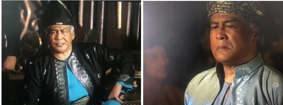
Gambar 6: Pemakaian Baju Songket oleh Dato' Raja Haji Muhamad

Pakaian rakyat bangsawan dalam filem ini pula hanya dipaparkan melalui watak Dato' Raja Haji Muhamad sahaja. Pakaian yang dipakai oleh beliau merupakan baju dan seluar yang diperbuat daripada kain songket. Hal ini dapat dikenal pasti menerusi corak yang ada pada baju dan seluar dipakai oleh Dato' Raja Haji Muhamad merujuk kepada gambar 6 di bawah: