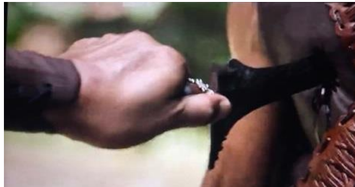
Gambar 3: Penggunaan Keris sebagai Senjata oleh Mat Kilau

Petikan di atas membuktikan bahawa senjata keris ini sememangnya telah digunakan oleh Mat Kilau pada zaman perjuangannya. Selain menjadi lambang kedudukan rakyat, keris juga dijadikan senjata menentang musuh. Menerusi filem MKKP (2022) , penggunaan keris sebagai senjata hanya dipaparkan menerusi watak Mat Kilau dan Pak Deris pada minit 102:37 dan minit 111:12. Kedua-dua watak ini menggunakan keris sebagai senjata untuk menikam pihak British ketika dalam pertarungan. Pemaparan penggunaan keris sebagai senjata menentang British dapat dilihat dalam gambar di bawah: