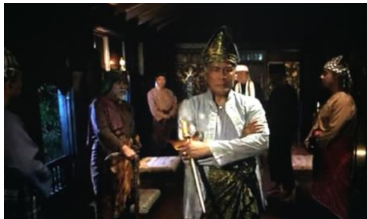
Gambar 2: Pemakaian Keris oleh Dato' Raja Haji Muhammad

Pemakaian keris dalam filem ini merupakan suatu usaha transformasi budaya daripada teks sejarah tokoh Mat Kilau ke dalam filem. Hal ini dapat dibuktikan menerusi hipoteks di bawah: