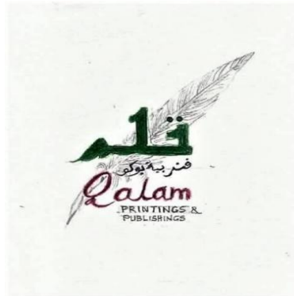
Rajah 2: Logo Syarikat Percetakan Qalam Press