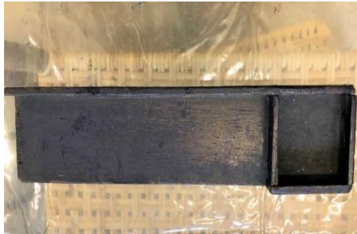
Rajah 5: Kotak kayu panjang dan berpetak untuk menyusun huruf timah

untuk dibentuk menjadi perkataan dan ayat, proses ini dinamakan 'kompos'. Huruf timah yang telah disusun dan diatur rapi itu kemudiannya akan diikat dengan benang supaya tidak bercerai.