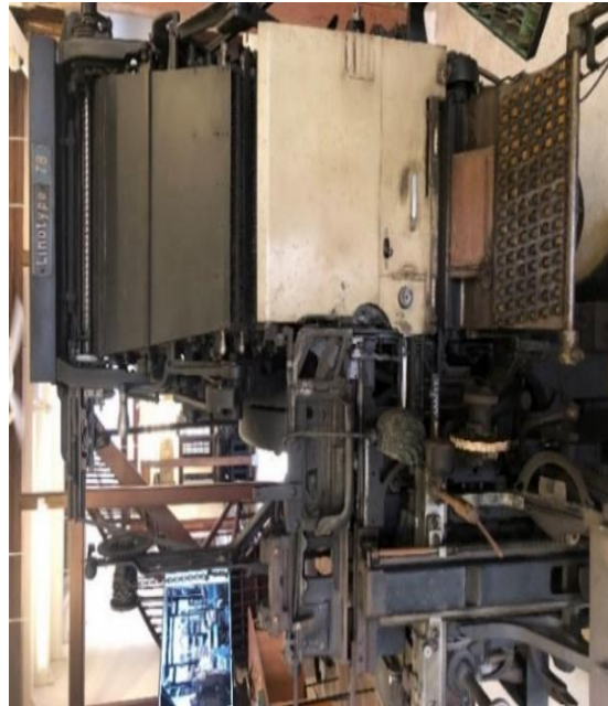
Rajah 7: Mesin Linotype digunakan oleh Qalam Press semasa beroperasi di Petaling Jaya pada tahun 1968.

Kaedah mengatur huruf digunakan dalam kebanyakan syarikat penerbitan di Tanah Melayu sehingga tahun 1950an (A. Samad, 1993). Hanya jentera mesin cetak 'Linotype' sahaja yang dapat menggantikan tugas pengatur huruf ini. Syarikat-syarikat yang bermodal besar seperti Malaya Publishing House Ltd. sahaja pada ketika itu mampu memiliki jentera 'Linotype' yang harganya mencecah $42 800.00 (Abdul Aziz, 1959). Apabila kebanyakan syarikat percetakan berpindah ke Kuala Lumpur selepas merdeka barulah mesin 'Linotype' meluas digunakan.