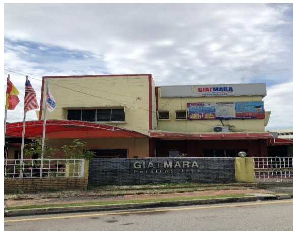
Rajah 9: Pejabat dan Kilang Percetakan Qalam Press di Jalan 225, Petaling Jaya. Kini sebagai Pusat Giat Mara

Alhamdulillah, telah tiba masanya kita mengambil keputusan memindahkan ibu pejabat kita ke Petaling Jaya, Kuala Lumpur sesudah mengadakan khidmatnya dari suatu ke suatu masa di pulau Singapura ini. Perpindahan yang kita lakukan tidak lain kerana mengikuti luasnya perkembangan bahasa kebangsaan di sana yang dahulunya kita perjuangkan bersama-sama terus-menerus sehingga tertaja Kongres Bahasa di Singapura yang menjadi bibit tumbuhnya kemajuan bahasa di seluruh tanah air ( Qalam , September 1967).