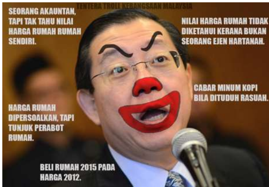
Rajah 4: Trolling politik 2 (Sumber:

Trolling politik 2 menunjukkan imej pemimpin Lim Guan Eng. Beliau merupakan Ketua Menteri Pulau Pinang dan memegang jawatan sebagai Setiausaha Agung parti pembangkang, Democratic Action Party (DAP). Internet trolling yang membabitkan imej beliau ini telah dimuatnaik pada 26 Mac 2016. Kapsyen yang diletakkan bersama-sama trolling politik tersebut adalah CM Lim Guan Eng bro, sudah2 la tu jadi badut . Isu yang diketengahkan dalam trolling politik ini adalah tentang pembelian rumah jenis banglo pada harga rendah daripada harga pasaran. Wajah beliau dalam trolling politik ini disunting sehingga berupa seperti badut. Dalam gambar itu pula diletakkan kenyataan-kenyataan yang dikeluarkan oleh Lim Guan Eng berkaitan isu rumah jenis banglo yang dibelinya. Trolling politik ini telah mendapat sebanyak 383 likes , 23 perkongsian dan 20 komen sehingga pemerhatian dibuat pada tahun 2016. Sumber trolling politik ini diambil daripada laman Tentera Troll Kebangsaan Malaysia.