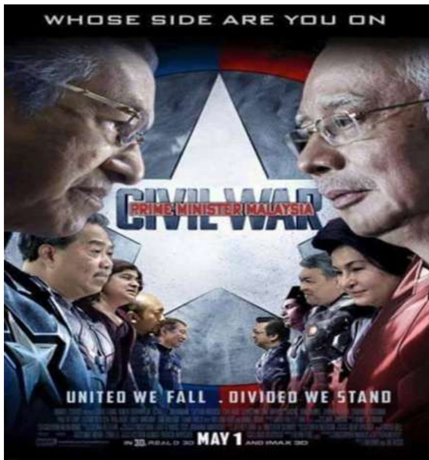
Rajah 5: Trolling politik 3 (Sumber:

Seri Najib Tun Razak untuk meletak jawatan, setelah usaha menarik sokongan ahli UMNO untuk menolak Perdana Menteri gagal. Majlis memeterai deklarasi itu disertai oleh bekas Timbalan Perdana Menteri, Tan Sri Muhyiddin Yassin; bekas Menteri Besar Kedah, Datuk Seri Mukhriz Mahathir; Veteran UMNO, Tan Sri Sanusi Junid dan juga pihak pembangkang, iaitu Menteri Besar Selangor merangkap Timbalan Presiden PKR, Datuk Seri Mohamed Azmin Ali; Penasihat DAP, Lim Kit Siang; Pengarah Pilihan Raya PAS Pusat, Datuk Mustafa Ali dan Presiden PAN, Mohamad Sabu. Pemimpin-pemimpin yang dahulunya berpihak kepada kerajaan telah melancarkan satu gerakan bersama pemimpin pembangkang dengan dakwaan gerakan ini bukan satu gerakan untuk menjatuhkan Barisan Nasional (BN) dan UMNO, sebaliknya bermatlamat untuk menyingkirkan seorang pemimpin. Perbalahan antara kedua-dua belah pihak ini yang dilihat sebagai perang saudara atau “civil war”. Trolling politik ini telah mendapat sebanyak 13,000 likes , 7, 831 perkongsian dan 649 komen. Sumber trolling politik pada Rajah 5 diambil daripada laman 9Gag Malaysia .