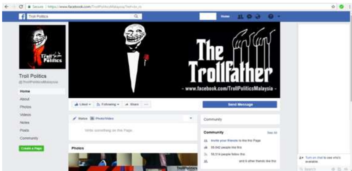
Rajah 1: Contoh laman trolling politik.

Trolling politik di Malaysia lazimnya dapat diakses melalui pelbagai aplikasi terutama sekali Facebook . Aktiviti memuatnaik ini menjadi semakin rancak apabila terdapat laman Facebook khusus tentang aktiviti ini. Proses penulatan bahan trolling tersebut menjadi mudah dan pantas dengan terdapatnya butang “perkongsian” yang tersedia dalam aplikasi Facebook tersebut. Antara contoh laman tersebut adalah Troll Politics yang pernah dihasilkan pada 1 Mei 2012 seperti Rajah 1 di bawah: