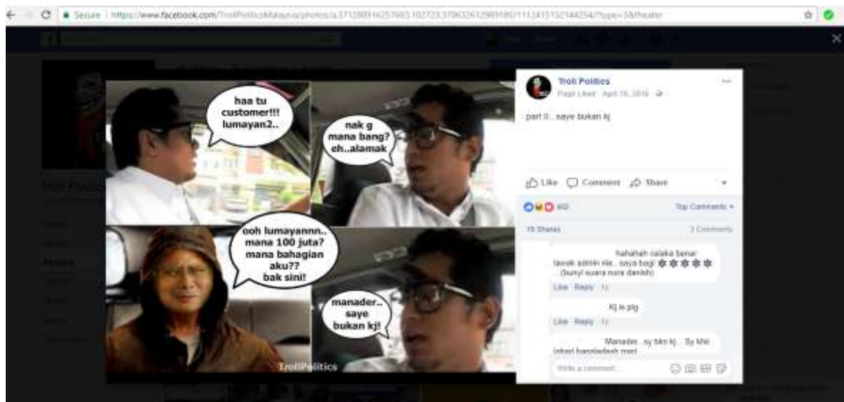
Rajah 2: Contoh muatnaik gambar trolling politik.