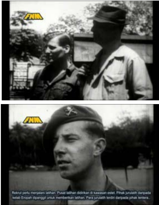
Rajah 4 : Busana yang ditunjukkan di dalam filem dokumentari The Kinta Story (1949)