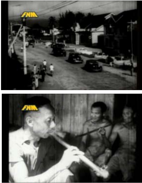
Rajah 3: Babak-babak yang menonjolkan setting di dalam filem dokumentari The Kinta Story (1949)