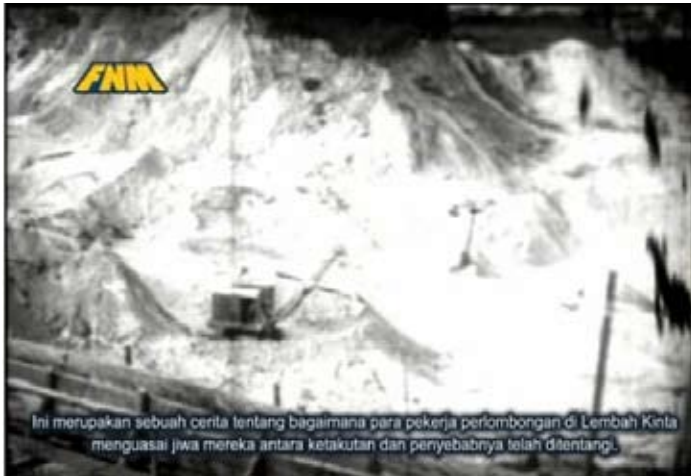
Rajah 1: Antara latar yang terdapat di dalam filem dokumentari The Kinta Story (1949)