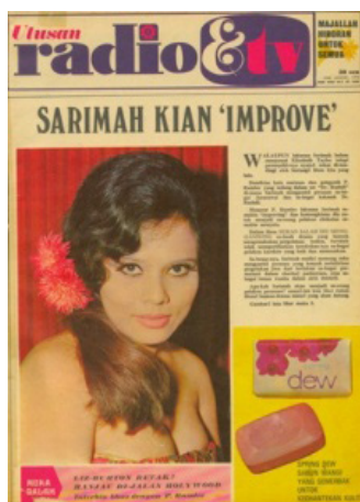
Gambar 1.0 Majalah URTV Keluaran Pertama 1970.

Majalah bertemakan hiburan dianggap sebagai nadi kelangsungan bagi syarikat-syarikat penerbit. Ini kerana majalah seperti ini menghadirkan cerita-cerita ringan dan sensasi berkaitan selebriti yang boleh menarik golongan pembaca. Penerbit majalah hiburan pula bukan lagi terbatas pada penerbit kecil yang mengambil peluang daripada kegilaan seketika seperti yang berlaku pada dekad 50-an dan 60-an, tetapi juga melibatkan penerbit besar seperti Utusan Melayu (M) Berhad. Kecenderungan ini menunjukkan bahawa majalah hiburan dianggap majalah yang berdaya maju ( viable ) oleh penerbit.