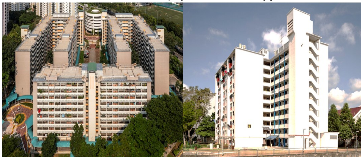
RAJAH 1. Contoh Rumah yang dibina oleh HDB di Singapura