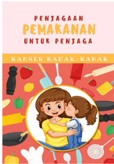
RAJAH 1. Bahan pendidikan bercetak bertajuk “Penjagaan Pemakanan untuk Penjaga Kanser Kanak-kanak”