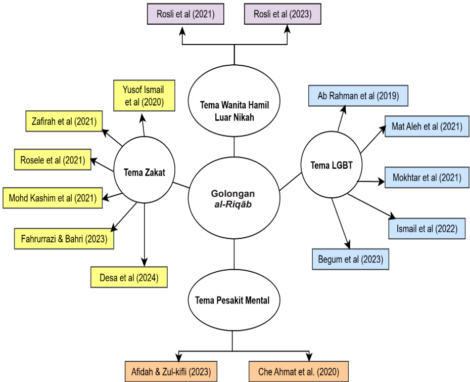
RAJAH 2 Ringkasan Tema Golongan al-Riqāb di Malaysia

Akhir sekali, pengkaji mendapati terdapat tema golongan pesakit mental yang dicadangkan untuk ditafsirkan sebagai asnaf al-Riqāb . Antaranya ialah kajian Afidah & Zul-kifli (2023) yang mengkaji persepsi masyarakat Islam terhadap cadangan perluasan konsep al-Riqāb bagi pemulihan pesakit mental. Selain itu, artikel kajian Che Ahmat et al. (2020) membincangkan perluasan konsep al-Riqāb kepada pesakit-pesakit mental. Ringkasan tema-tema ini seperti berikut: