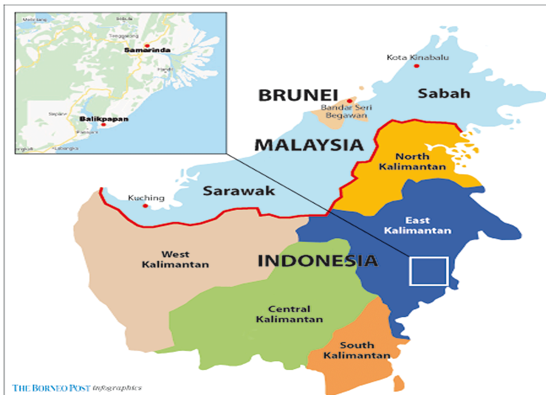
Peta 1: Ibu Kota Indonesia di Kalimantan