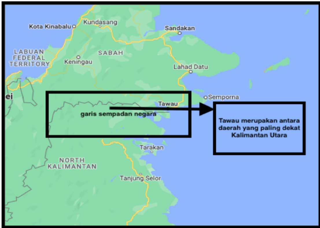
Peta 2: Persempadanan antara Sabah dan Kalimantan Utara