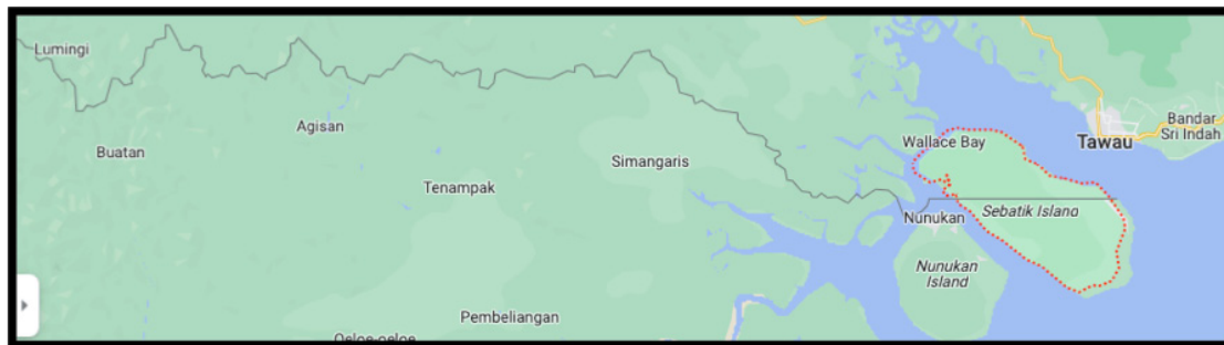
Peta 3: Kawasan di Garis Sempadan Negara iaitu Buatan, Agisan, Simangaris dan Pulau Sebatik

Berdasarkan peta 1 sehingga peta 3, garis persempadanan darat antara Kalimantan Utara dan Pantai Timur Sabah adalah sepanjang 2,019.5 kilometer dan perpindahan ibu kota tersebut sudah pasti memberikan impak yang signifikan terhadap hubungan diplomatik dan keselamatan Malaysia khususnya di kawasan Pantai Timur Sabah yang terdiri daripada Tawau, Lahad Datu dan Sandakan.