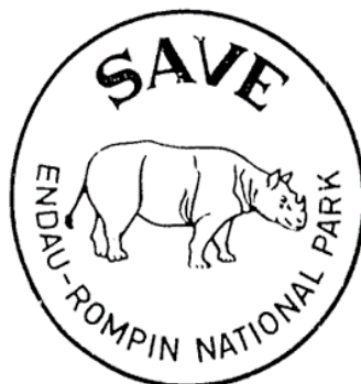
Rajah 2: Badak Sumbu Sumatera dijadikan simbol untuk kempen Selamatkan Taman Negara Endau-Rompin.

Ketegasan Kerajaan Negeri Pahang dalam membenarkan aktiviti pembalakan terus berlaku di kawasan Taman Negara Endau-Rompin yang dicadangkan telah mencetuskan bantahan awam yang lebih bersemangat dan satu kempen 'Selamatkan Taman Negara Endau-Rompin' ( Save Endau-Rompin National Park ) telah dilancarkan dengan menggunakan badak sebagai simbol (rajah 2). 71