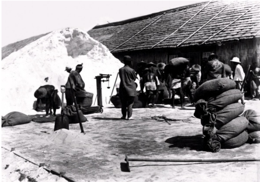
Rajah 1.2 Tempat Penghasilan Garam Semasa Penaklukan Jepun Di Taiwan Sumber: Tu Po Keng, “Wei Ri Jun Kai Cheng Men De Ta Wan Ren Gu Xian Rong Yi Sheng Ying Zhao De Li Shi Shen Si,” DW News , 12 Disember 2019. 27

situ untuk memproses penghasilan garam dan menanam tebu.