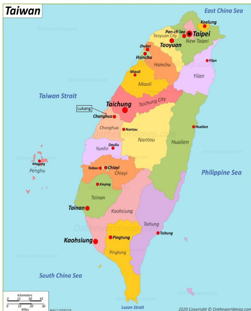
Peta 1.1 Peta Kawasan Lugang di Taiwan

Lugang di Taiwan. Garam di Taiwan mula dieksport ke luar negara dan tidak hanya dijual dalam negara. Eksport garam ke Jepun 24 secara besar-besaran telah membawa keuntungan yang lumayan kepada Koo Hsien Jung.