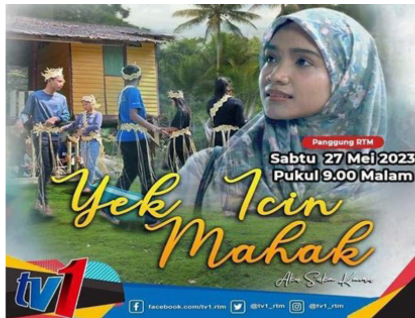
RAJAH 1. Poster filem 'Yek Icin Mahak'

Semasa menonton filem ini, dialog yang diujarkan oleh watak-watak akan ditranskripsi ke dalam bentuk teks bagi memudahkan pengkaji menganalisis ujaran-ujaran tersebut. Seterusnya, tontonan filem akan dilakukan secara berulang-ulang kali bagi mengenal pasti lakuan pertuturan yang terdapat dalam filem ini dan membaca berulang-ulang kali lakuan pertuturan yang terdapat dalam dialog. Data yang dikumpulkan melalui tontonan dan proses transkripsi akan dianalisis menggunakan Teori Lakuan Pertuturan Searle (1969) mengikut kategori dan subkategorinya. Proses pengumpulan data juga akan diteruskan lagi dengan proses penelitian dan semakan dengan lebih mendalam melibatkan beberapa sumber rujukan. Kajian ini turut melibatkan kaedah kepustakaan bagi mendapatkan