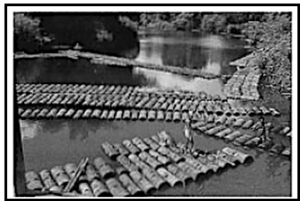
ILUSTRASI 2. Gambar Je'tuei (Flach 1997)

Menuda' (Penerangan fonetik: bunyi e mewakili bunyi schwa dan tanda ' mewakili bunyi hentian glotis). Menarik keratan rumbia dari tebing sungai ke sapan atau ke kilang memproses sagu.