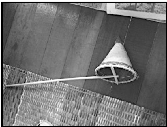
ILUSTRASI 3. Gambar teghusuong .

Teghusuong (Penerangan fonetik: bunyi e mewakili bunyi schwa; ng mewakili bunyi nasal velar; bunyi gh mewakili bunyi geseran lelangit lembut). Alat menimba air yang berbentuk kon dan mempunyai sebatang pemegang yang panjang. Alat ini digunakan untuk menimba air dari sungai untuk dituangkan ke atas pou ketika sedang memijak inti rumbia yang diparut di atas idiah .