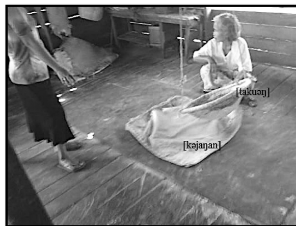
ILUSTRASI 4. Peralatan— takuong dan kejangan

Kejangan (Penerangan fonetik: bunyi e mewakili schwa dan ng mewakili bunyi nasal velar). Tikar berbentuk segi empat yang digunakan untuk membentuk biji sagu yang bulat. Caranya ialah dengan menarik dan mengangkat tepi tikar ke atas dan kemudian meletak ke bawah; lihat Ilustrasi 4. Tepung sagu yang berada di tikar akan berubah menjadi bebola kecil apabila gerakan ini dibuat berulang kali. Biji sagu ini dijadikan bahan tambahan dalam makanan seperti dalam puding dan bubble tea .