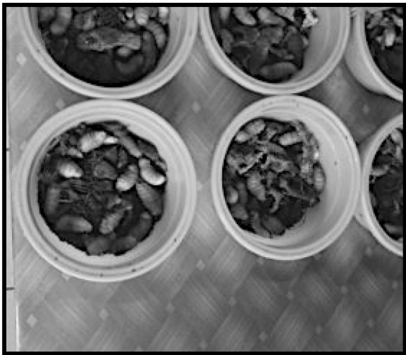
ILUSTRASI 5. Si'et yang dijual di pasar tempatan

merupakan makanan istimewa dalam masyarakat Melanau, khususnya suku Melanau bukan Islam. Di tempat lain di Nusantara, misalnya di Papua New Guinea dan Maluku, ulat sago juga dimakan oleh penduduk setempat. Ulat sago boleh dimakan dengan cara memanggang, digoreng ataupun dimakan mentah. Dari segi khasiatnya, Collins dan Novotny (1991) mencatatkan bahawa: Because sago is mostly carbohydrate, and the grub is mostly protein (14% dry mass) and fat (64% dry mass). The grub provides an essential element to the diet, in the absence of fish or meat. Not only is the protein essential, but the fat is essential for the absorption of fat-soluble vitamins, to put it another way, the diet becomes complete, except for some vitamins and minerals, with sago and the grub.