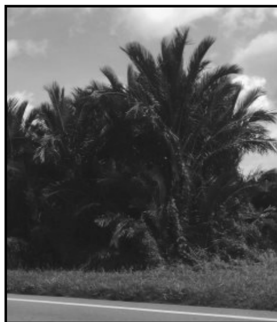
ILUSTRASI 1. Pohon balau , Metroxylon sagu

ini boleh tumbuh dalam kebanyakan tanah, dari tanah yang salirannya baik hinggalah tanah yang kurang berkualiti, seperti tanah berpasir dan tanah liat (MacClathey et al. 2006). Istilah balau ini merupakan kata yang mengalami inovasi leksikal. Dalam Proto Melayu-Polynesian (PMP), pohon rumbia di rekonstruksi oleh Blust sebagai *Rumbia (lihat Tryon 1994). Pada umumnya, kebanyakan bahasa dari cabang Melayu-Polinesia berkongsikan kognat set ini. Antara contoh yang dimaksudkan ialah: lumbiya (Cebuano), rumbia (Malay), umbizo (Kadazan), tumba (Gorontalo), dan humbia (Sangir); lihat Dutton (1994). Perlu dicatat bahawa kognat ini juga dijumpai pada bahasa Melayu-Polinesia cabang timur, contohnya lapia (Asilulu di Indonesia timur); lihat Collins (2007). Namun demikian, dalam bahasa Melanau (salah satu cabang bahasa Melayu-Polinesia juga), istilah rumbia ini wujud sebagai balau . Menurut Blust (2015), balau di rekonstruksi dalam Proto Melayu-Polinesia sebagai sejenis pohon yang menghasilkan balak (lihat juga Zorc 1994). Dalam Wilkinson (1932), kata balau dalam bahasa Melayu yang wujud dalam bentuk kerja membalau bermaksud ‘mengupas’, ini sejajar dengan salah satu langkah memproses sagu, iaitu mengupas kulit pohon rumbia yang telah ditebang. Jadi mungkin istilah balau ini telah mengalami perubahan semantik dalam bahasa Melanau. Sesungguhnya kajian lanjut seperti rekonstruksi semantik perlu dilaksanakan ke atas kata ini.