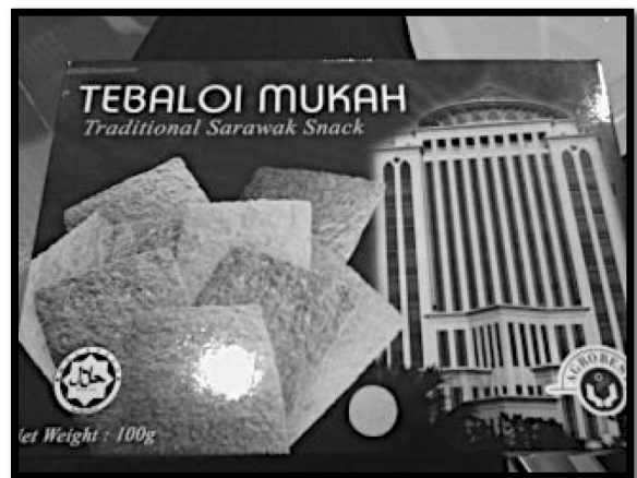
ILUSTRASI 6. Contoh tebaloi

Tebaloi (Penerangan fonetik: bunyi e mewakili bunyi schwa). Sejenis makanan ringan yang diperbuat daripada tepung sago yang bercampur dengan telur, kelapa kisar dan gula. Campuran tersebut akan diapit sehingga nipis dan dipanggang sehingga rangup.