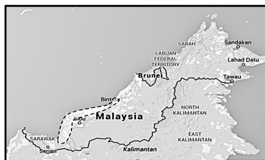
PETA 1. Kawasan pertumbuhan pohon rumbia di Sarawak

tahun 1950-an kerana kejatuhan harga komoditi ini. Sejak itu, ramai pengeluar sagu telah meninggalkan sektor ini dan berkecimpung dalam sektor ekonomi lain, misalnya pembalakan, di pelantaran minyak, sektor perikanan dan sebagainya. Kini, sagu masih dihasilkan secara berskala kecil dengan teknik moden dan tradisional untuk kegunaan tempatan.