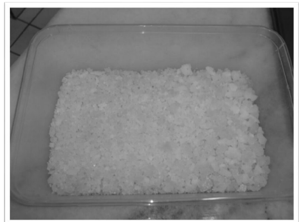
Sira kasar yang telah dibacakan doa dan jampi untuk ditabur di sekeliling rumah