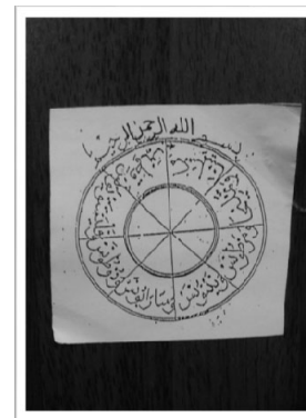
Beberapa contoh ayat yang kurang jelas maksudnya turut dijadikan azimat dan 'pendinding' rumah