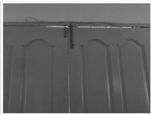
Sejenis tangkal berupa ekor ikan pari yang disimpan di atas pintu masuk utama sebagai 'pendinding' agar semua unsur jahat tidak dapat menembusi ke dalam rumah