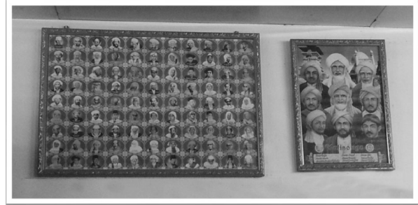
Gambar Syarif Kedah dan para alim ulama (wali-wali) yang menjadi 'pendinding' rumah kerana dipercayai membawa berkat