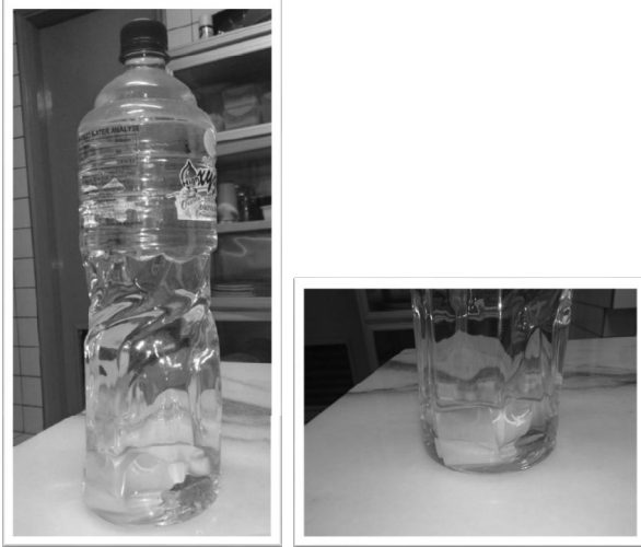
Botol berisi air yang mengandungi kertas jampi untuk disiram di empat penjuru rumah sebelum didiami