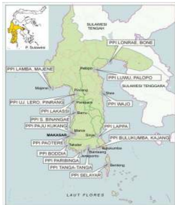
Rajah 1. Provinsi Sulawesi Selatan

Kajian ini dilaksanakan di kawasan Paotere, Kecamatan Ujung Tanah, Kota Makassar (Rajah 1). Pengambilan data untuk menyusun makalah ini dilakukan dengan menggunakan metod pemerhatian ikut serta dan temu bual mendalam terhadap 20 informan yang berkaitan dengan isu kajian. Selain itu, pelbagai data sekunder diperolehi dari pejabat-pejabat yang berkaitan dengan kajian, iaitu Kantor Dinas Kelautan dan Perikanan, Provinsi Sulawesi Selatan dan Kanto Biro Pusat Statistik Kota Makassar.