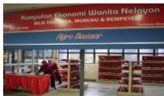
Foto 4. Tempat jualan KEW di Agro Bazaar Kuala Muda