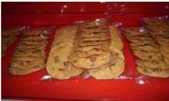
Foto3. Produk rempeyek