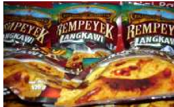
Foto 2. Produk rempeyek ikan bilis