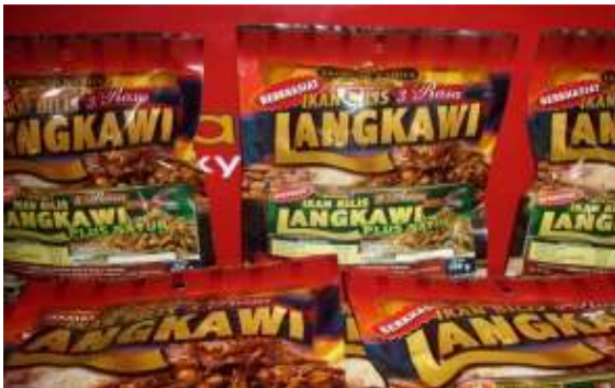
Foto 1. Produk ikan bilis tiga rasa

produk mereka di tempat tersebut. Dengan pelan pemasaran yang dirangka kini, anggota KEW menjangkakan bahawa produk makanan ringan mereka akan dapat menembusi pasaran seluruh negara satu hari nanti (Temubual dengan Pengerusi KEW, 2009).