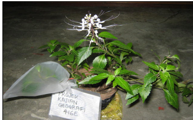
Gambar 1. Proses sejat peluhan oleh pokok Misai Kucing