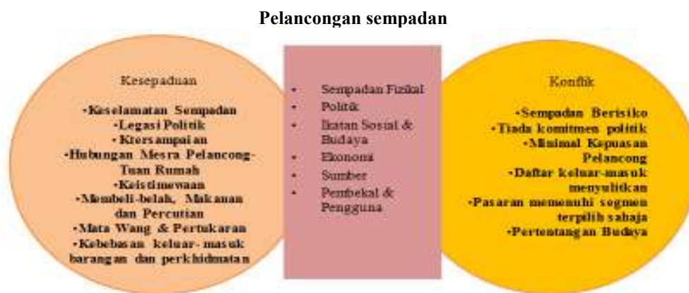
Rajah 2. Kerangka konsep pelancongan sempadan

Gabungan faktor yang mengarah kepada kesepaduan dan konflik dijangka memesatkan aktiviti pelancongan sempadan bagi kedua-dua belah pihak, terutama kepada pembekal perkhidmatan pelancongan dan para pelancong.