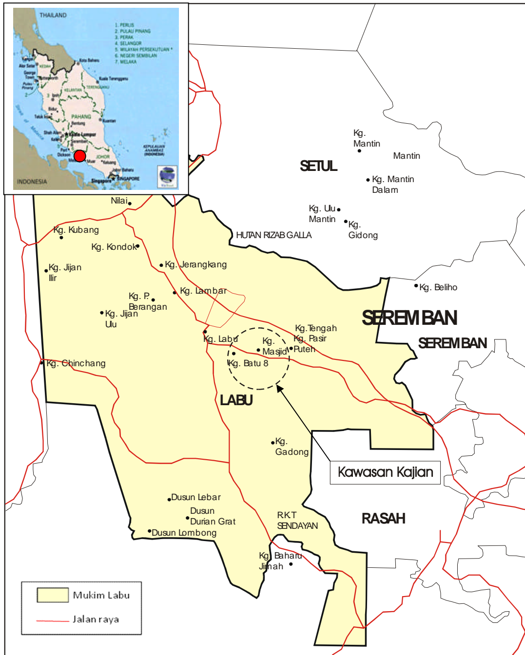
Rajah 1: Kawasan Kajian