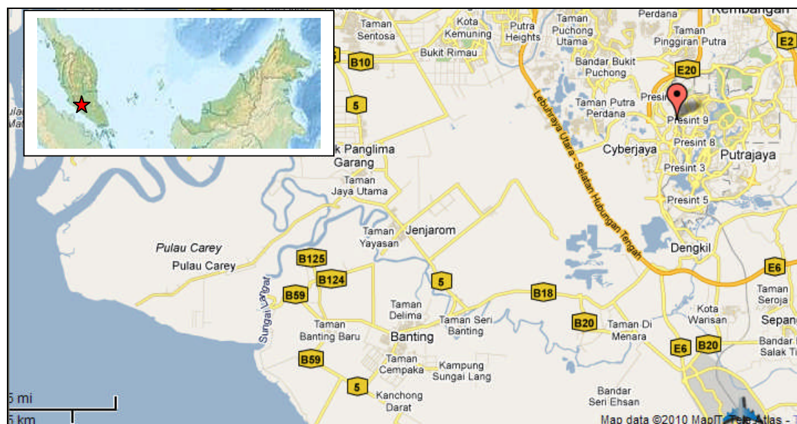
Peta 1. Lokasi Cyberjaya

Cyberjaya ; terletak dalam lingkungan Koridor Raya Multimedia (MSC). Berhampiran dengan Bandar Pintar, Bandar Taman Putrajaya iaitu bandar pentadbiran kerajaan persekutuan dan juga KLIA. Cyberjaya dikhususkan sebagai kawasan kluster R&D industri berteknologi tinggi dan perkhidmatan. Telah dibangun sejak tahun 1995 pada era Tun Mahathir sebagai perdana menteri Malaysia. Kawasan technopole Cyberjaya juga dikenali sebagai bandar pintar (intelligent city) (Peta 1).