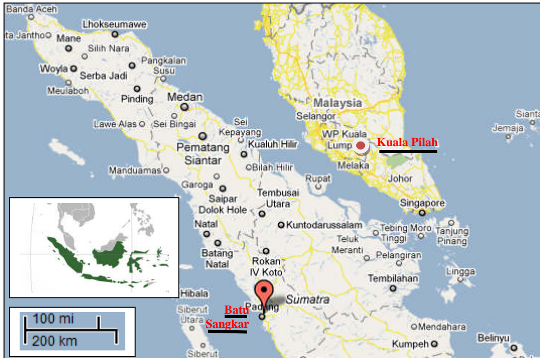
Rajah 1. Lokasi kajian

dan Negeri Sembilan, Malaysia (Rajah 1) dalam mengurus tanah adat. Sehubungan itu penelitian terhadap gelombang perubahan yang membawa perubahan hakpakai tanah adat akan diteliti dalam usaha memahami bentuk falsafah dan sistem tanah pusaka adat di antara kedua-dua buah negara. Sehubungan itu, kertas ini akan menggunakan pendekatan institusi ekonomi bagi mengupas evolusi serta permasalahan tanah adat dikedua-dua buah negara.