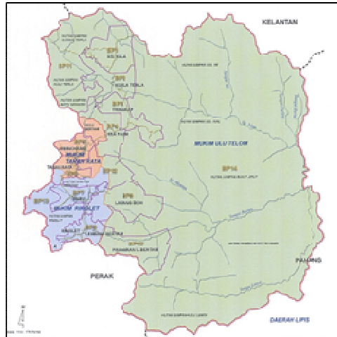
Sumber: Rancangan Tempatan Daerah Cameron Highlands, 2002-2015