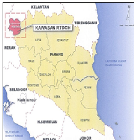
Sumber: Rancangan Tempatan Daerah Cameron Highlands 2002-2015

Cameron Highlands atau Tanah Tinggi Cameron merupakan sebuah pusat peranginan tanah tinggi yang terkenal di Semenanjung Malaysia. Cameron Highlands merupakan daerah yang terkecil di Negeri Pahang yang terletak di Banjaran Titiwangsa pada aras 1070 meter hingga 1830 meter dari aras laut. Kawasan ini melibatkan 3 mukim utama iaitu Mukim Ulu Telom, Tanah Rata dan Ringlet dengan 9 buah pusat petempatan kecil (Rancangan Tempatan Cameron Highlands, 2002-2015). Daerah ini mempunyai keluasan kira-kira 71,218 hektar dengan jumlah penduduk seramai 30,495 orang (Laporan Statistik Negeri Pahang, 2014). Puncak tertinggi bagi tanah tinggi Cameron adalah Gunung Brinchang yang mempunyai ketinggian 2031 meter (6666 kaki) dari aras laut. Jalan perhubungan utama ke Cameron Highlands adalah melalui Tapah melalui Lebuhraya Utara Selatan dan Simpang Pulai, manakala pintu masuk utama iaitu Kg. Raja bagi pelancong dari Ipoh (Perak) dan Gua Musang (Kelantan). Tarikan utama adalah produk pelancongan berasaskan pertanian dan alam semula jadi, manakala antara tarikan lain ialah Taman Rama-rama, Rainbow Garden , Market Square dan The Smoke House . Daya tarikan ini memberi ruang dan peluang kepada pihak kerajaan dan swasta menjalinkan hubungan yang konstruktif untuk meningkatkan produk pelancongan tanah tinggi di kawasan ini (Pelan Transformasi Pelancongan Negeri Pahang, (PTTP), 2015 (Rajah 3 & 4).