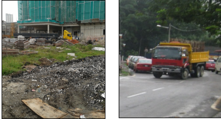
Rajah 4. Pengeluaran bunyi kuat dari tapak pembinaan dan pergerakan lori