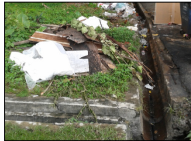
Rajah 3. Sisa pepejal pembinaan di dalam dan di tepi sistem perparitan di kawasan kajian