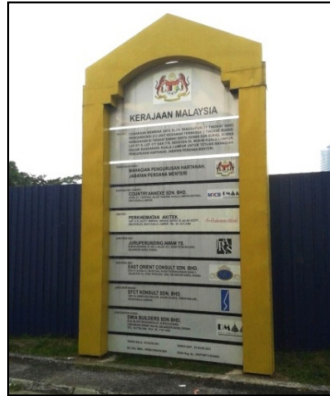
Rajah 2. Papan informasi yang terletak di depan tapak pembinaan

terperinci. Ini menunjukkan bahawa sikap penduduk tempatan yang tidak mengambil berat tentang proses perubahan yang berlaku di kawasan persekitarannya.