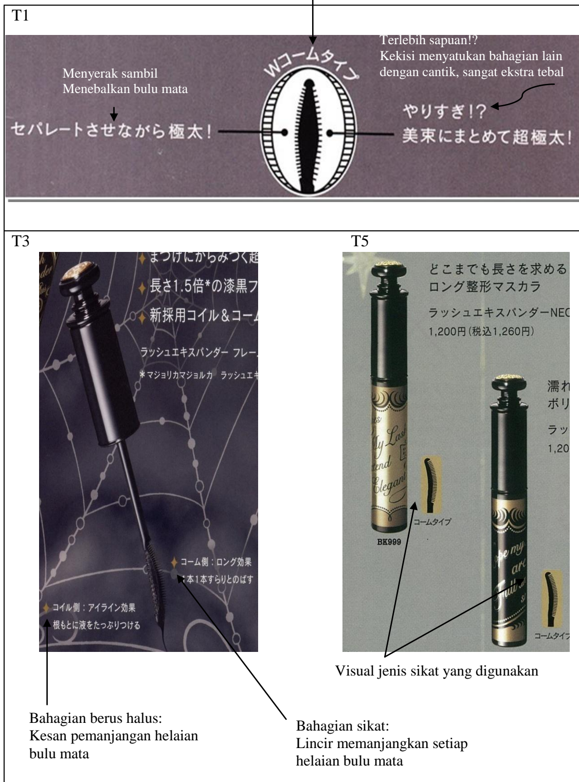
RAJAH 1. Fungsi berus dan sikat ditonjolkan dan diserlahkan dalam bentuk visual