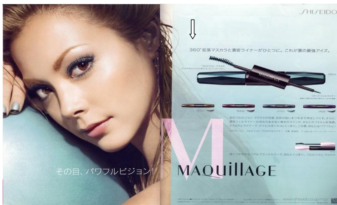
RAJAH 3. T2 Contoh teks iklan yang memanfaatkan angka 360°

Selain mengaplikasikan angka dalam bentuk wacana matematik seperti contoh (14) iaitu, ‘Maskara peanjang dan boleh mengembangkan sehingga 360°’, peratusan sebanyak ‘tiga ratus enam puluh darjah/360°’ yang dijelmakan dalam wacana iklan merupakan pendekatan hiperbola yang cenderung kepada strategi moden atau Barat sebagaimana yang didakwa oleh Okazaki dan Mueller (2008, hlm. 778), “ US ads, however, were more likely to employ comparative appeals an hyperbole, while Japanese advertising tended to emphasise mood and nature ” Ungkapan tersebut menggambarkan secara hiperbola bahawa produk tersebut boleh berfungsi sehingga bulu mata boleh dilentikkan, dipanjangkan dan diserakkan sehingga 360°.