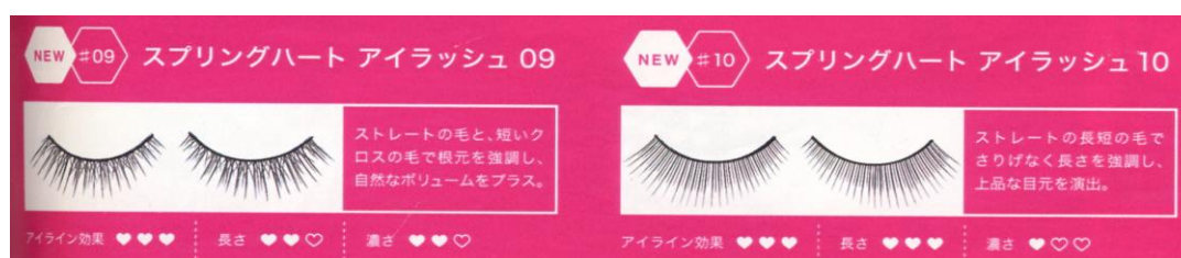
RAJAH 2. Lakaran imej bulu mata palsu dalam Teks 8

Sebagaimana produk maskara, produk bulu mata palsu juga turut mengaplikasikan imej lakaran bagi membekalkan gambaran yang jelas (rujuk Rajah 2) dan dalam masa yang sama turut membantu khalayak membuat pilihan.