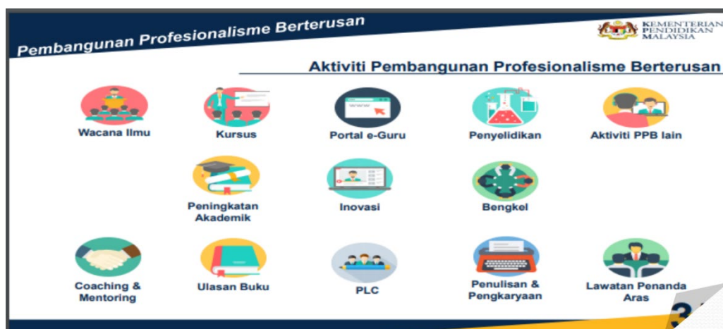
Rajah 1. Aktiviti PPBG

Kajian terdahulu menunjukkan bahawa penglibatan guru dalam aktiviti PPBG adalah pada tahap yang tinggi, walaupun terdapat beberapa kajian yang menekankan batasan dan dapatan yang bercanggah dengan amalan tersebut. Sebaliknya, kajian oleh Rosnah et al. (2013) mendapati guru sekolah berprestasi tinggi yang kerap mengamalkan aktiviti pembangunan profesional menunjukkan hasil yang positif untuk kedua-dua jenis aktiviti, iaitu aktiviti secara individu dan secara berkumpulan. Amalan yang tinggi ini jelas menunjukkan bahawa guru-guru sentiasa melibatkan diri dalam PPB, mempunyai komitmen yang tinggi, dan bersemangat untuk belajar. Kajian Mohd Izham et al. (2020) juga menunjukkan dapatan yang tinggi. Kajian tinjauan kuantitatif ini mengkaji hubungan antara amalan kelestarian sekolah oleh pentadbir dengan pembangunan kecekapan PPBG 302 orang guru di daerah Pasir Puteh, Kelantan. Dengan skor 4.40, dapatan tersebut menunjukkan bahawa pembangunan kecekapan PPBG guru berada pada tahap yang tinggi. Data ini menjelaskan bahawa guru-guru di daerah Pasir Puteh, Kelantan mengamalkan PPBG yang kukuh, yang menyumbang kepada tahap KPP yang tinggi. Oleh yang demikian, bagi mengekalkan tahap ini, guru-guru perlu sentiasa berusaha untuk meningkatkan diri melalui pembelajaran berterusan kerana aktiviti pembelajaran formal dan tidak formal ini amat penting bagi guru-guru untuk berkembang dalam pengetahuan dan profesionalisme (Rosnah et al., 2013).