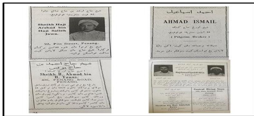
Foto 3. Iklan Sheikh Haji dalam Pemandu Jemaah Haji , 1965

Menurut Muhammad Saleh (2009), antara cabaran yang cukup hebat perlu dihadapi oleh Sheikh Haji adalah berpunca daripada perbuatan merampas jemaah haji Sheikh Haji lain. Meskipun perbuatan tersebut hanya berlaku dalam bilangan yang kecil, namun ianya tetap memberikan kesan negatif kepada kelicinan proses pengurusan haji. Terdapat segelintir Sheikh Haji atau wakil mereka yang bersikap tidak bertanggungjawab dengan mendekati jemaah haji orang lain semasa mereka berada di pelabuhan ataupun di dalam kapal (Mohd Zulfadhli, 2011). Jemaah haji yang menjadi mangsa akan dipujuk rayu, ditawarkan imbalan, ditipu ataupun diperas ugut oleh Sheikh Haji supaya mereka mengubah Sheikh Haji mereka mengikut apa yang disarankan (Muhammad Saleh, 2009). Kesannya, setelah berjaya mendapatkan wang komisyen ataupun upah yang sepatutnya, Sheikh Haji terbabit akan bersikap lepas tangan dan tidak mahu ambil peduli terhadap jemaah haji yang diperdaya oleh mereka. Berikutan perkara tersebut, satu peraturan baru telah dikeluarkan bagi mereka yang hendak menunaikan haji sama ada melalui Pelabuhan Swettenham, Klang ataupun Pelabuhan Pulau Pinang, perlu mengisi maklumat diri dan menyerahkannya kepada kadi di kawasan mereka bagi mengelakkan kes penipuan oleh Sheikh Haji dan pada masa yang sama membantu kerajaan negeri untuk menyalurkan sebarang berita yang berlaku terhadap jemaah haji kepada waris dan saudara mara (Fail 1957/0216221, Sel. Sec. 2595/1921).