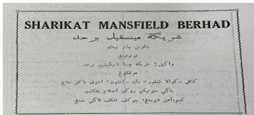
Foto 1. Iklan syarikat perkhidmatan kapal laut semasa musim haji

Jalinan dan kerjasama yang erat antara Sheikh Haji dan wakil syarikat perkapalan juga amat penting bagi menjamin kelancaran perkhidmatan yang ditawarkan oleh mereka. Terdapat banyak syarikat perkapalan yang mula muncul silih berganti dalam usaha menyediakan perkhidmatan pelayaran kapal laut ke Pelabuhan Jeddah. Antara syarikat perkhidmatan kapal haji pernah menawarkan perkhidmatan kepada jemaah haji Tanah Melayu suatu ketika dahulu ialah The Ocean Steam Ship Company Limited atau The Blue Funnel Line yang cukup sinonim dengan pengangkutan haji dalam kalangan orang Melayu. Sementara itu, ejen yang dilantik mewakilinya di Singapura dan Pulau Pinang ialah Mansfield and Company . Mansfield and Company juga merupakan ejen bagi The China Navigation Company yang kemudiannya turut terlibat dengan pengangkutan jemaah haji menggantikan The Blue Funnel Line .