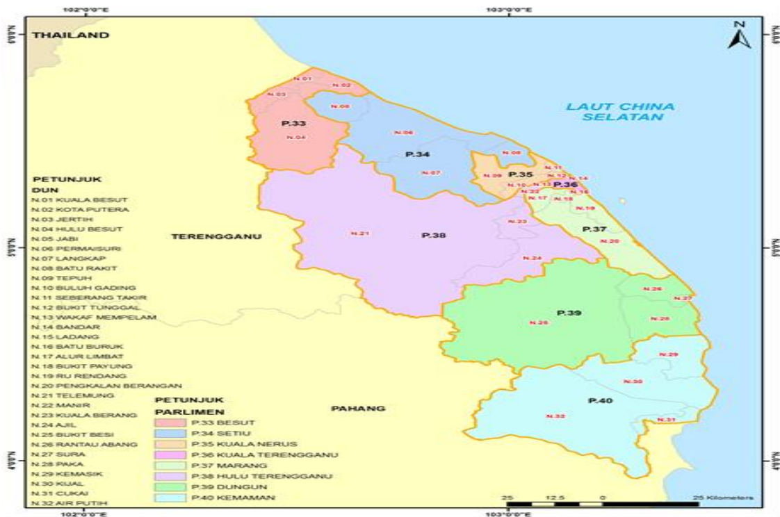
Rajah 1: Peta Bahagian Pilihan Raya Parlimen dan DUN di Negeri Terengganu

Terengganu adalah salah sebuah negeri daripada 13 buah negeri dibawah negara Malaysia. Terengganu terletak di timur Semenanjung Malaysia, ia bersempadanan dengan negeri Kelantan dan negeri Pahang. Terengganu terletak di antara garisan lintang 4 hingga 5.50 dan garisan bujur 102.25 hingga 103.50. Keluasan negeri Terengganu ialah 13,035 sq. km yang mewakili 4 peratus keluasan Malaysia. Terengganu memiliki 4 buah pulau di sekelilingnya iaitu Pulau Kapas, Pulau Tenggol, Pulau Perhentian dan Pulau Lang Tengah. Jumlah penduduk negeri Terengganu ialah 1,183,400 juta orang (Data asas negeri Terengganu 2016). Komposisi penduduk Terengganu mengikut etnik pada 2015 ialah menunjukkan bahawa 94.6 peratus adalah Melayu, 2.5 peratus ialah Cina, 0.3 peratus adalah etnik India, 0.3 peratus lagi ialah bumiputera lain dan 0.2 peratus adalah etnik-etnik lain. Dicatatkan juga, jumlah penduduk Terengganu melibatkan bukan warganegara sahaja adalah 2.1 peratus. Apa yang menariknya, negeri Terengganu mencatatkan jumlah penduduk bumiputera yang tertinggi dalam Malaysia iaitu 94.8 peratus (Taklimat Membangun Terengganu 2016). Negeri Terengganu mempunyai 8 kawasan Parlimen dan 36 kawasan DUN (Lihat Rajah 1).