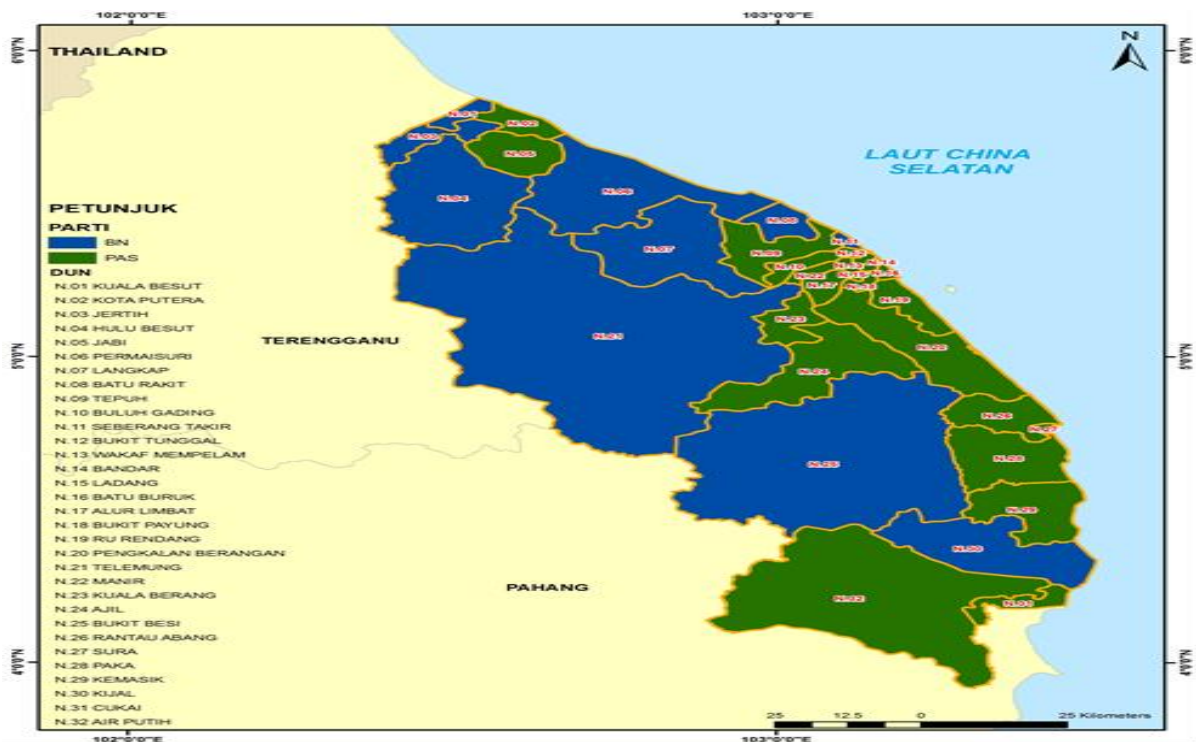
Rajah 3: Peta Taburan Geografi Kerusi DUN yang dimenangi Parti Politik dalam PRU-14, 2018 di Negeri Terengganu Darul Iman

sebarang kerusi. Maka, terdapat jurang perbezaan yang ketara mungkin disebabkan oleh faktor populariti parti politik dan calon yang bertanding. Kesemua jumlah 22 kerusi DUN yang dimenangi oleh PAS ialah DUN Kota Putera, Jabi, Tepuh, Buluh Gading, Bukit Tunggul, Wakaf Mempelam, Bandar, Ladang dan Batu Buruk. Selain itu, PAS juga turut menang di kerusi DUN Alur Limbat, Bukit Payung, Rhu Rendang, Pengkalan Berangan, Manir, Kuala Berang, Ajil, Rantau Abang, Sura, Paka, Kemasik, Cukai dan Air Putih (Rujuk Rajah 3).