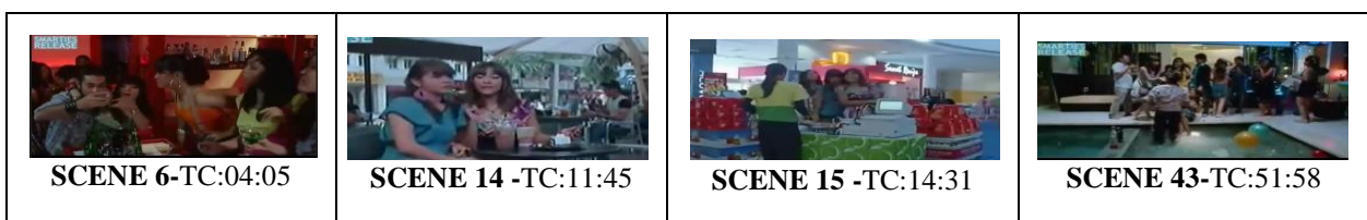
Jadual 3: Latar Paparan Gaya Hidup Remaja Melayu Islam dalam AMD

Paparan latar lokasi kelab malam pada Scene 6 memaparkan gaya hidup moden remaja Melayu moden di bandar yang hanyut dengan gaya hidup hedonik dan bebas berhibur di kelab malam, pergaulan bebas, mabuk dan ketagihan dadah di waktu malam. Latar lokasi di luar kafe dalam Scene 14 menggambarkan gaya hidup remaja di bandar, sambil minum berbincang-bincang dan cuba mencari teman lelaki. Dalam Scene 15 di Mall menggambarkan ketiga-tiga sahabat dengan gaya hidup mewahnya berbelanja. Sofea sebagai anak orang kaya tolong membayarkan pembelian sahabat-sahabatnya. Lokasi di rumah Zack di Scene 43 , pula memaparkan aktiviti remaja, anak-anak golongan mewah dengan pergaulan bebas, minum sampai mabuk, pengambilan dadah dan pesta seks.