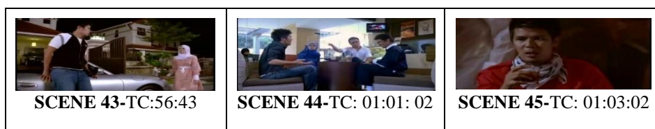
Jadual 6: Kelemahan Logika Perwatakan dan Proses Hubungan Sebab Akibat dalam SC

Kata ‘ Bismillah ’ yang terucap dari bibir Irham memperlihatkan usaha AI menyelitkan proses psikologi atas dorongan tanpa sedar dalam watak Irham menjadi diri sendiri yang lebih baik dan mengubah gaya hidup modennya yang tersasar. Sandiwara hijrahnya selama sebulan bersama Syuhadah telah memberikan impak terhadap jiwa dan cara berfikir yang lebih matang. Tindakannya keluar dari kelab malam meninggalkan teman-temannya yang lain adalah bukti dia sudah mula berfikir tentang masa depan dirinya dan makna cinta sejati sebenar yang ada dalam keperibadian muslimah Syuhadah.