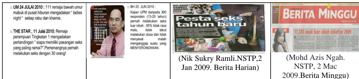
Jadual 1: Keratan Akhbar tentang Isu Remaja 2009-2010