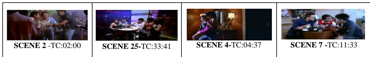
Jadual 2: Paparan Latar Gaya Hidup Remaja Melayu Moden SC

Gaya hidup yang dipaparkan iaitu gaya hidup bebas di kelab malam di waktu malam dalam Scene 2 dan 25 . Juga dalam Scene 4 dipaparkan gaya hidup seks bebas Irham yang membawa gadis yang baru dikenal ke rumah. Juga gaya hidup hedonik Scene 7 yang memaparkan aktiviti melepak sambil minum dan menjamu selera di kafe.