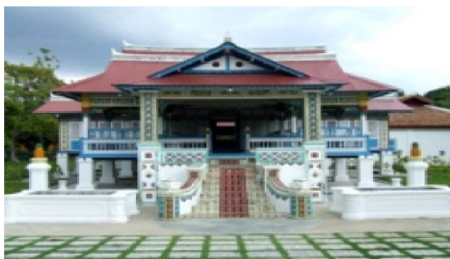
Gambar1: Rumah Penghulu Abdul Ghani 20

dinding dan tiang konkrit yang rosak, mengikis dan mengecat semula, menanggalkan dan memasang jubin seramik, merobohkan dinding tambahan, membaik pulih struktur kerangka dan kemas bumbung serta kerja-kerja berkaitan seperti membaik pulih pelamin, kabinet dinding, tempat memasak, kabinet dapur, kolah bilik air serta tiang dan pelbagai motif ukiran. Usaha tersebut penting bagi mengekalkan warisan peninggalan nenek moyang untuk generasi akan datang.