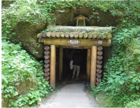
Gambar 3: Bahagian Dalam Terowang IWAMI 26