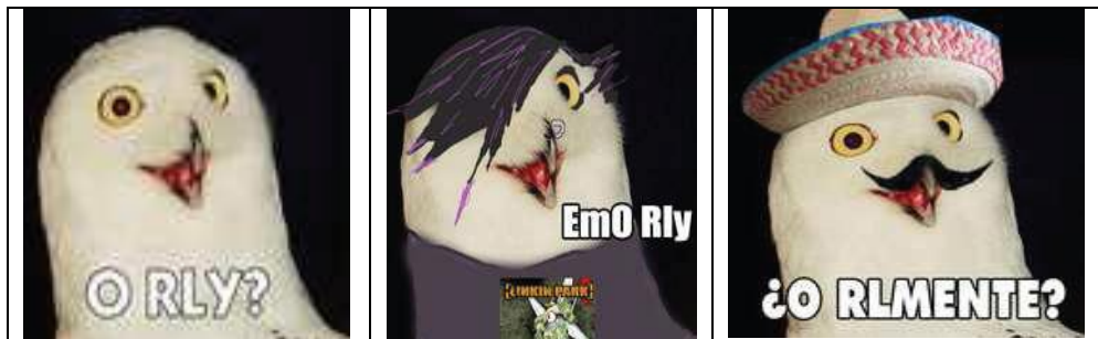
Rajah 1: Peniruan dalam Meme.