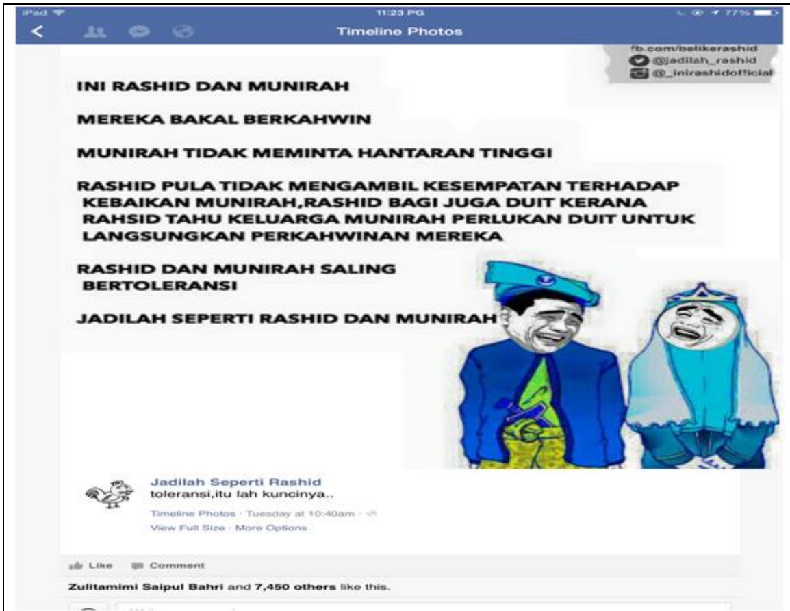
Rajah 5: Isu Wang Hantaran Perkahwinan.

Meme berbentuk keganasan juga sering kali di lihat di media sosial sejak kebelakangan ini. Pembentukan meme ini adalah berikutan isu-isu yang berlaku akibat daripada ketidakpuasan hati segelintir pihak terhadap sesuatu perkara. Meme bergenre keganasan ini juga kadang kala timbul akibat daripada pengaruh daripada filem-filem barat yang kadang kalanya menyelitkan unsur-unsur ganas di dalamnya. Oleh yang demikian, meme genre ini menjadi pilihan bagi sesetengah individu untuk menerangkan sesuatu perkara yang berlaku. Kadang kala meme jenis ini timbul akibat daripada percanggahan pendapat mengenai fahaman politik dan sebagainya. Walaupun dari sudut luaran ianya tidak ketara, namun pengaruh meme jenis keganasan ini boleh di kesan di dalam laman sosial sesetengah masyarakat yang memprotes dan membangkang pentadbiran kerajaan yang sedia ada dengan melakukan mogok ataupun provokasi terhadap pentabiraan kerajaan. Oleh itu, timbul lah pergaduhan dan percanggahan pendapat dalam sesebuah masyarakat, contohnya dalam perhimpunan Bersih yang berlaku pada suatu ketika dahulu. Pergaduhan yang tercetus tersebut telah menimbulkan kesan yang serius terhadap reputasi dan sistem ekonomi di Malaysia. Rentetan daripada teristiwa tersebut, maka terhasil lah pelbagai jenis meme yang berunsurkan pergaduhan dan keganasan mengenai isu tersebut. Meme jenis ini amat membimbangkan kerana mampu mencemarkan pemikiran golongan kanak-kanak yang menerimanya.