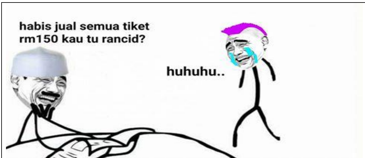
Rajah 4: Isu Ulat Tiket Semasa Perlawanan Akhir Bola Sepak Dalam Sukan Sea 2017.