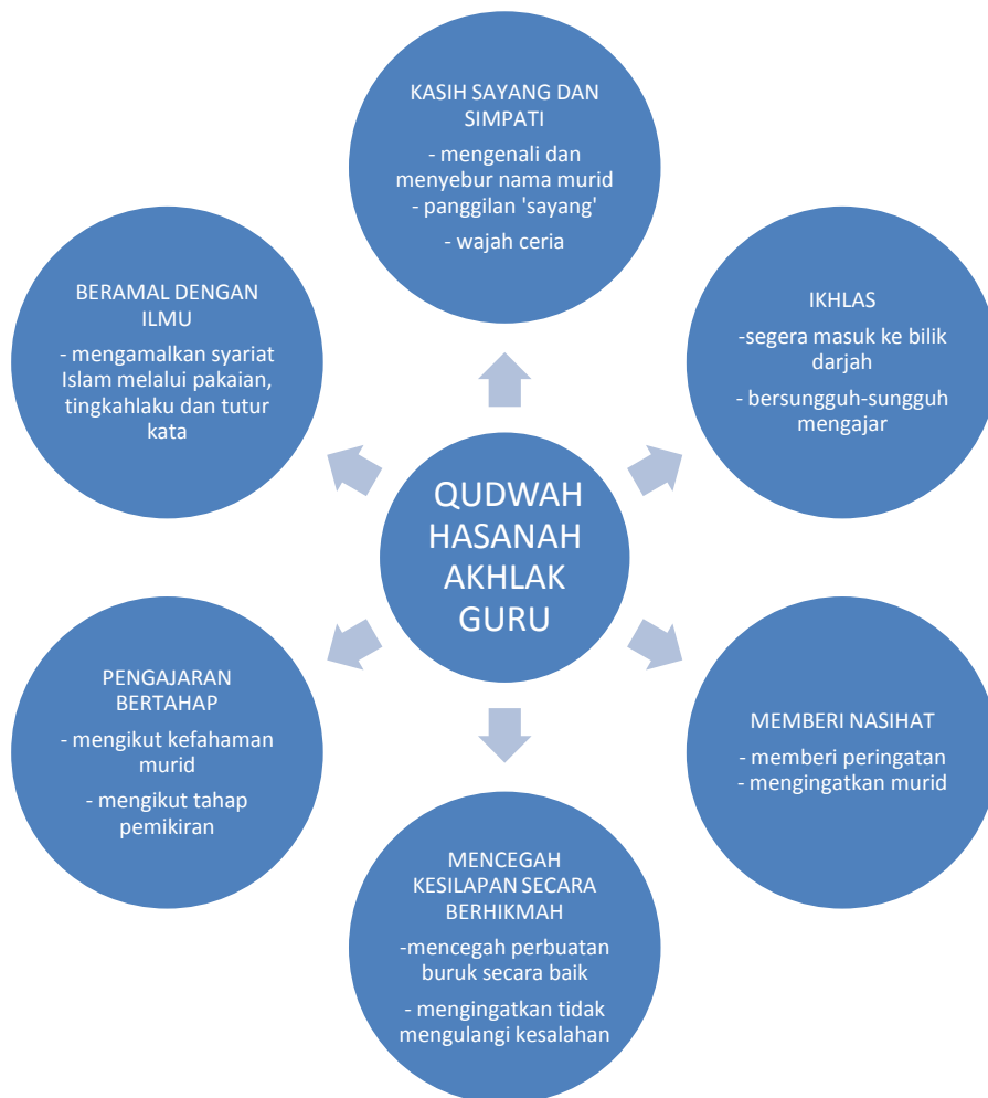
RAJAH 2. Qudwah Hasanah Akhlak Guru

Pengkaji mendapati tiga ciri beramal dengan ilmu yang dilaksanakan oleh peserta kajian iaitu pertama guru mengamalkan syariat Islam dari segi pakaian, tingkah laku dan tutur kata. Guru berpakaian menutup aurat, kemas dan sesuai dengan etika profesional seorang guru Muslim atau Muslimah. Kesemua mereka berpakaian kemas dan menutup aurat menepati garis panduan yang ditetapkan oleh syariat. Mereka juga berhati-hati mengeluarkan kata-kata semasa proses P&P supaya tidak mengeluarkan perkataan yang kurang baik. Peserta kajian sangat menjaga tingkah laku mereka di dalam bilik darjah. Mereka menjaga akhlak antara bukan mahram, ini kerana semua murid berlainan jantina merupakan 'ajnabi' atau bukan mahram dengan mereka. Mereka tidak menyentuh murid yang berlainan jantina dan menjaga adab berbicara dengan murid-murid. Ini bertepatan dengan kajian Nurul Hudani, Marof dan Noor Hisham (2013) bahawa kecerdasan emosi guru yang positif melahirkan akhlak dan tingkah