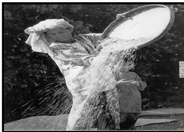
GAMBAR 4. Wanita Melayu Sedang Menampi Padi

lelaki dan golongan wanita bagi mendapatkan hasil padi yang berkualiti sama ada untuk tujuan eksport dan juga untuk kegunaan sendiri.