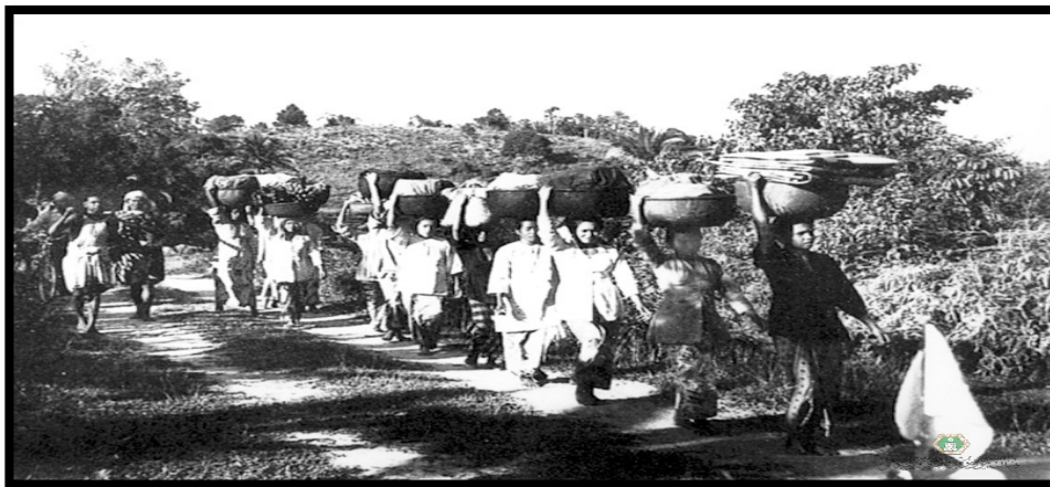
GAMBAR 5. Segerombolan Wanita Melayu di Terengganu Sedang Membawa Segala Hasil Pertanian untuk Dijual

telah mengeluarkan perbelanjaan antara $3,000 hingga $4,000 untuk pembinaan stor padi yang dilihat menyenangkan petani dalam aktiviti pengeluaran padi. Dengan bantuan yang disalurkan, secara langsung meningkatkan semangat wanita untuk terus terlibat dalam kegiatan penanaman padi. Diakui, antara faktor utama kenaikan jumlah eksport beras yang dinyatakan adalah disebabkan oleh sikap golongan wanita Terengganu yang cukup rajin. Menurut laporan tahunan Terengganu pada tahun 1925, “they are more industrious and diligent women workers than any I have yet met in the Malay Peninsula and they are clever and efficient workers” (Annual Report of Terengganu 1925). Misalnya, setelah menuai hasil padi, golongan wanita akan keluar berniaga setiap hari ke pasar dengan membawa hasil tersebut di atas kepala. Bukan sekadar hasil padi, malah mereka turut menjual pelbagai keperluan masyarakat tempatan. Malah, terdapat juga dalam kalangan mereka yang membawa hasil tanaman padi sehingga ke kawasan bandar bagi mendapatkan hasil yang lebih lumayan.