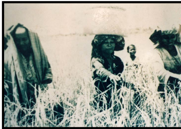
GAMBAR 3. Wanita Melayu Sedang Mengirik (melaikan buah daripada tangkai) Padi Menggunakan Tangan

Manakala proses keempat iaitu proses terakhir ialah mencedung dan menampi. Kaedah ini akan dijalankan secara bergotong royong antara golongan