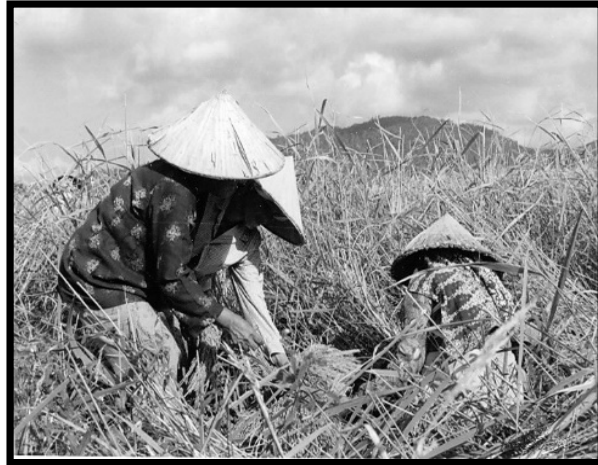
GAMBAR 1. Wanita Melayu Sedang Mengetam Padi

tangkai padi yang telah masak untuk dijadikan sebagai gemal (gemal) padi.