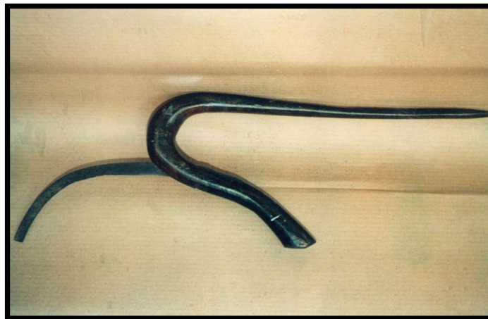
GAMBAR 2. Pisau Pengiaiu untuk Memotong Tangkai Padi yang Rebah

atau memotong tangkai (tengkok) padi. Kaedah ini sering kali dilakukan ke atas pokok padi yang rebah. Kaedah ini dijalankan dengan menggunakan pisau mengerat.