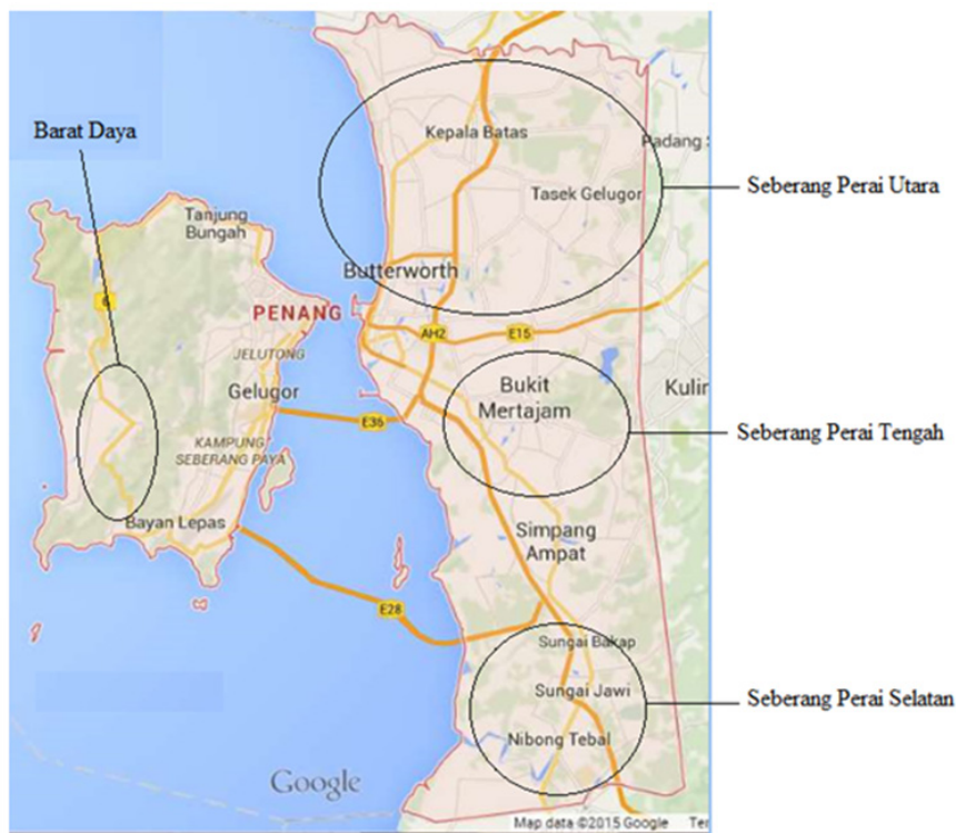
RAJAH 1. Peta negeri Pulau Pinang

Dalam empat buah daerah ini, terdapat lebih kurang 10 kawasan atau lokasi pertanian padi iaitu Bakau Tok Kiat, Pokok Kenanga, Sungai Acheh, Sungai Kulim, Bumbung Lima, Pokok Sena, Padang Menora, Air Melintas dan Pinang Tunggal. Kesemua lokasi-lokasi tersebut telah dibahagikan mengikut skim-skim pengairan yang mendapat sumber bekalan air dari beberapa batang sungai. Skim pengairan merupakan satu sistem pengairan dan saliran yang dibina dan disediakan oleh pihak Kawasan Pembangunan Pertanian Bersepadu Pulau Pinang (IADA Pulau Pinang). Sistem-sistem pengairan dan saliran yang dibina merangkumi struktur-struktur kawalan bagi tujuan mengawal pembekalan air, pembuangan air dan penjadualannya agar air dapat digunakan secara optima. Secara keseluruhannya, terdapat 6 skim pengairan yang menempatkan lokasi-lokasi dalam kajian ini iaitu Skim Pengairan Sungai Muda dan Skim Pengairan Pinang Tunggal yang terletak